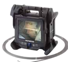
工業用ビデオスコープ