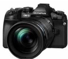
デジタル一眼カメラ OM-D E-M1 Mark II