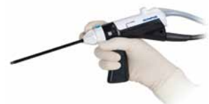
副鼻腔手術用デブリッダー