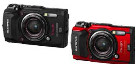
コンパクトデジタルカメラ TG-5