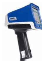
ハンドヘルド蛍光X線分析計