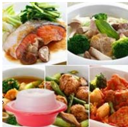
複数ラインナップの糖質制限食を提供