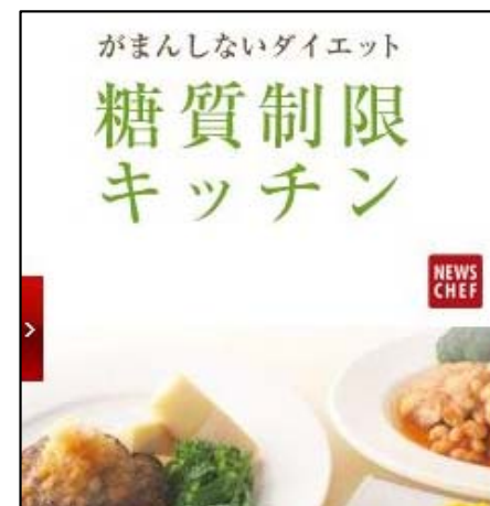
糖質改善など健康を切り口としたレシピ開発