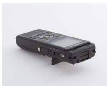
「スタンド」使用イメージ

会議室のテーブルのような固い場所の上で録音する場合、ペンで書く音やコップを置く音をレコーダーが拾ってしまう場合があります。本製品に内蔵された「スタンド」を、必要に応じて使用することでマイクがある上面を浮かして設置できるため、設置面からの雑音の影響を低減できます。使用しない場合は本体内に格納できるため、持ち運びの際、邪魔になることはありません。