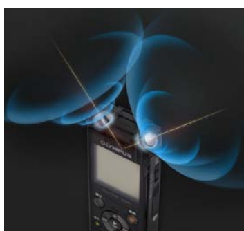
「トゥルーステレオマイク」透視イメージ図

「Voice-Trek V-843」「Voice-Trek V-842」には、ローノイズの指向性マイク 2 個を 90 度の角度で外側に向け配置した「トゥルーステレオマイク」システムを搭載しています。会議や商談での発言者の方向はもちろん、距離感までリアルに捉え、まるでその場にいるような臨場感あふれる高音質ステレオ録音を実現しています。