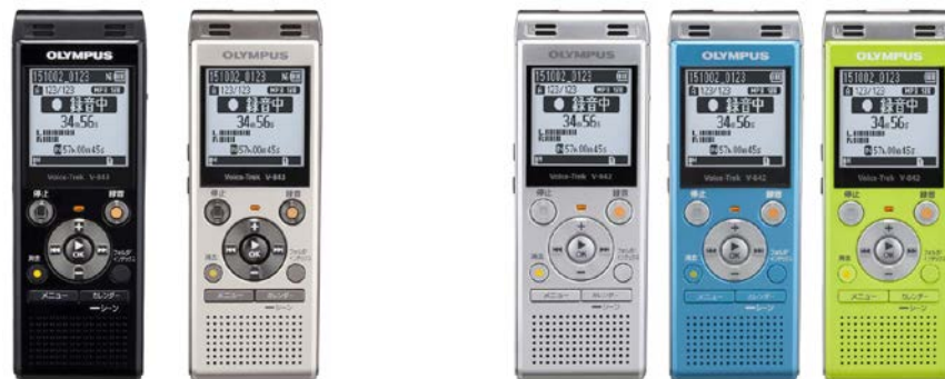
Voice-Trek V-843 ピアノブラック シャンパンゴールド