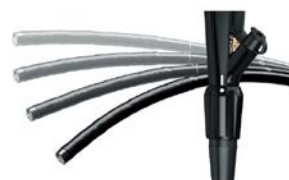
硬度可変のイメージ図