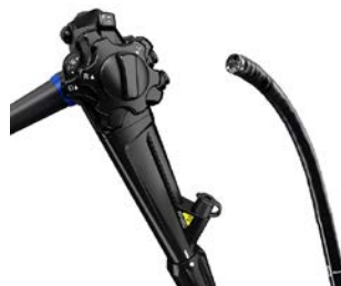
「EVIS LUCERA ELITE 大腸ビデオスコープ OLYMPUS PCF-H290Z シリーズ」

当社は戦略的事業拡大に向けグループの再編を行い、2015 年 4 月 1 日より、オリンパスメディカルシステムズ(株)の機能は会社分割により一部を除いてオリンパス(株)に承継されました。医療事業は「消化器科」、「外科」、「泌尿器科婦人科」、「耳鼻科」、「医療サービス」の 5 事業ユニットで構成されており、本大腸ビデオスコープは「消化器科」の製品です。