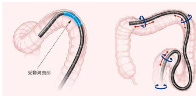
受動湾曲部のイメージ図

操作者の操作性向上や患者さんの苦痛軽減を目指した3つの技術が搭載されています。屈曲した形状の大腸でスムーズな挿入を行えるよう、腸壁にスコープが当たると自然に曲がる「受動湾曲」機能や、大腸の形状や長さによって操作者の手元側の力をより効率的に先端に伝えるための「高伝達挿入部」そして手元で挿入部の硬度を変えられる「硬度可変」機能を搭載しました。これにより、検査効率の向上と患者さんの苦痛の軽減に貢献します。