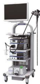
狭帯域光観察（NBI）機能を搭載した 内視鏡ビデオスコープシステム「EVIS LUCERA ELITE」

※1 Narrow Band Imaging は、オリンパス株式会社の登録商標です。