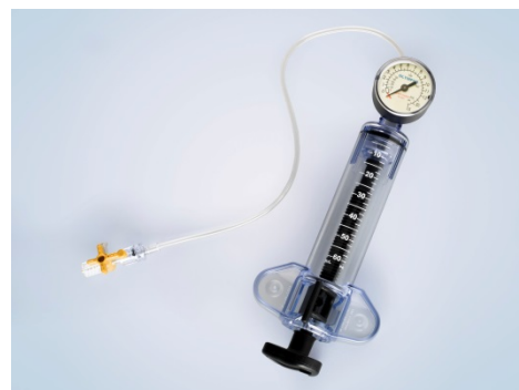
【バルーンダイレーター用インフレーションデバイス MAJ-1740】