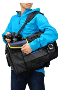
機材取り出しイメージ

さまざまな収納パターンに対応できるように、中仕切りは6種類、合計18個を同梱しています。厚さ12mmで十分なクッション性を備えており、取り付け位置は自在に移動、あるいは取り外しが行えるため、機材の分量、内容に合わせて最適なセットアップが行えます。取り出し口もメイン部以外にバックパック左手側にサイドドアが設けられ、迅速な内部へのアクセスや取り出しが行え、撮影時の機動性向上に貢献しています。このサイドドアは「OM-D E-M1 Mark II」にパワーバッテリーホルダー「HLD-9」を装着した状態でもスムーズに取り出しできるよう、開口部が広めに設計されています。