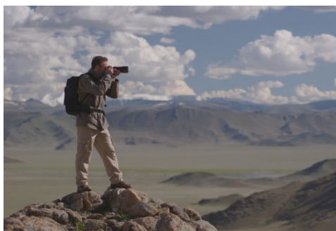
フィールドでの使用イメージ

カメラバックパック「CBG-12」の外側には、アウトドア用のザックにも使われ、高い強度と耐候性を誇る2520D(デニール)※ 2 のポリエステル生地を採用しています。適所に芯材とクッション材を効果的に入れることで耐衝撃性を上げ、さらに表面に十分な撥水性を施し、収納した撮影機材を安全にガードします。加えて、汚れやすく傷がつきやすい底面には、防水性と耐摩耗性に優れたターポリン生地を用い、ゴム製の脚を付けることで、防汚性、耐久性をさらに向上させています。