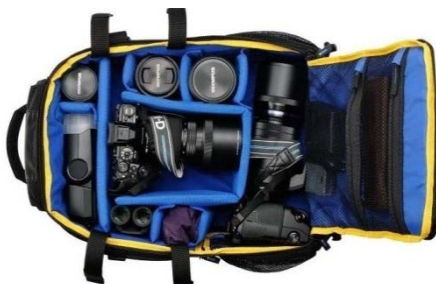
「CBG-12」機材収納イメージ

カメラバックパック「CBG-12」は、パワーバッテリーホルダー「HLD-9」を装着した状態のミラーレス一眼「OM-D E-M1 Mark II」を2セット、「M.ZUIKO DIGITAL ED 7-14mm F2.8 PRO」、「M.ZUIKO DIGITAL ED 12-40mm F2.8 PRO」、「M.ZUIKO DIGITAL ED 40-150mm F2.8 PRO」、「M.ZUIKO DIGITAL ED 300mm F4.0 IS PRO」といった交換レンズに、エレクトロニックフラッシュ「FL-900R」などの各種アクセサリ、さらにノートパソコンを含めた撮影に必要なフルシステムを余裕をもって収納できる大容量設計となっています。これだけの高い収納力を備えながらも、航空機の機材持ち込みサイズをクリアするほどコンパクトにまとめられ、撮影工程の間、常に身近に機材を置くことができます。