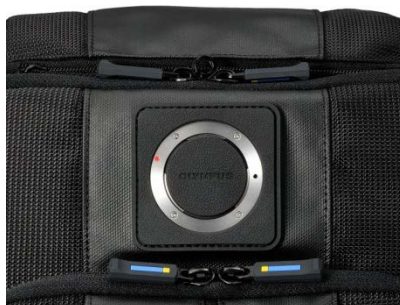
「OM-D」シリーズで使用された ステンレスマウントそのものを エンブレムに採用

背面には「OM-D E-M1 Mark II」にも使われているものと同じステンレス鋼のレンズマウントをエンブレムとして取り付けています。このエンブレムには、カメラバックパック「CBG-12」が「OM-D」シリーズの持つ高い信頼性、機動性とまったく同じ設計思想で作られているというオリンパスからのメッセージが込められています。