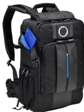
カメラバックパック「CBG-12」