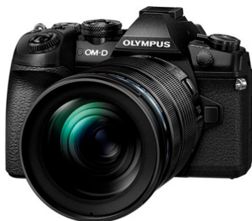
「OM-D E-M1 Mark II」 (対象商品はボディのみ)

オリンパス株式会社(社長: 笹 宏行)は、フォトパス※ 1 会員向けサービス「オリンパス オーナーズケアプラス」(OOC+)※ 2 から、「OM-D E-M1 Mark II」専用のお得なサービスプラン「E-M1 Mark II 専用メンテナンスパッケージ」を 12 月 22 日(木)より発売します。期間中通話料無料の専用サポートデスク、定期の整備・調整および保証が最長 4 年間※ 3 受けられるなど、オーナーの皆様にはカメラを安心、快適な状態で使い続けていただけるための充実したサービス内容となっています。