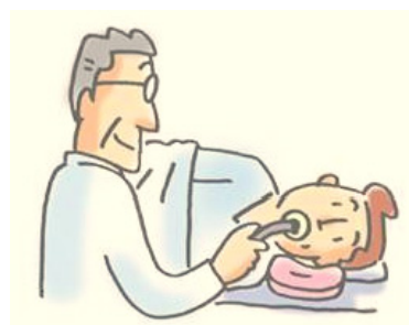
上部内視鏡検査の様子(イメージ)