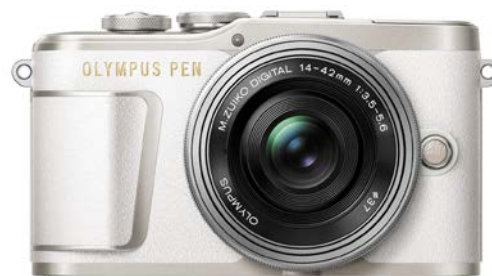
A賞:「OLYMPUS PEN E-PL9 EZ レンズキット(ホワイト)」

※1 内視鏡医学のさらなる発展と普及を願い、(財)内視鏡医学研究振興財団が7月14日を「内視鏡の日」と制定しました。7と14で「内視(ないし)」と読む語呂合わせから日付が決定され、日本記念日協会から2006年7月に認定を受けています。