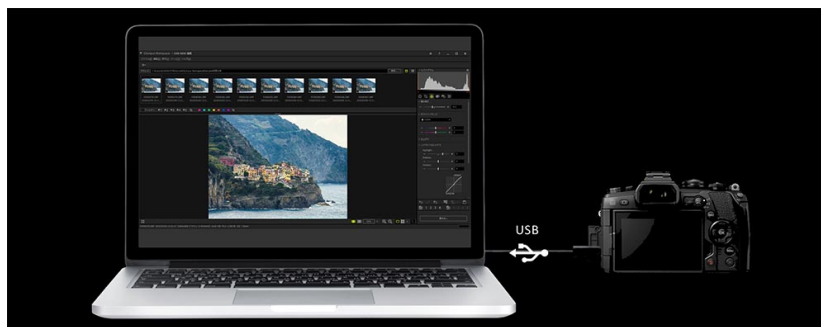
画像処理エンジン TruePic VIII を使用して圧倒的に高速な RAW 現像が可能

パソコンとカメラを USB で接続し、「OM-D E-M1 Mark II」、「OM-D E-M1X」の画像処理エンジン「TruePic VIII」を活用することで、「Olympus Workspace」の RAW 現像の大幅な高速化を実現した新機能 USB RAW 編集 *2 を追加しました。