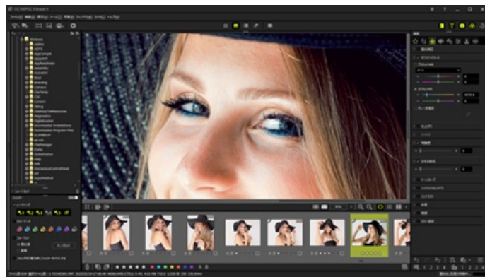
画像編集ソフトウェア「Olympus Workspace」