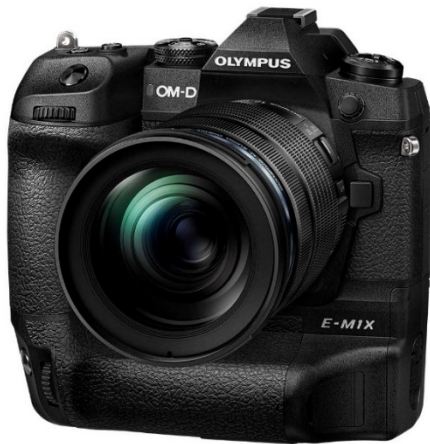
「OM-D E-M1X」 +「M.ZUIKO DIGITAL ED 12-100mm F4.0 IS」