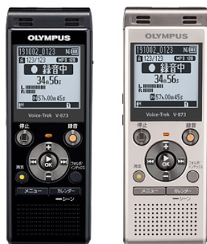
Voice-Trek V-873 (ピアノブラック/シャンパンゴールド)