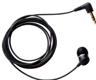
テレホンピックアップ「TP8」

「Voice-Trek V-873」「Voice-Trek V-872」などの IC レコーダーのマイクジャックにつなぎ、マイク部分を装着して通話すれば、その内容を明瞭に録音できるインナーイヤー方式の電話録音用マイクです。スマートフォンや携帯電話でも使用可能な汎用タイプとなっています。