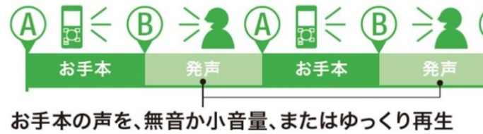
「シャドーイング」作動イメージ図