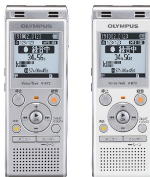
Voice-Trek V-872 (シルバー/ホワイト)