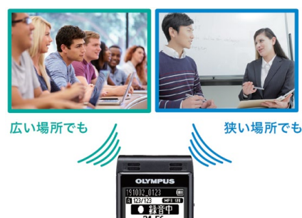
録音レベルを最適に自動調整