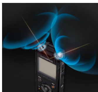
「トゥルーステレオマイク」イメージ図

ローノイズの指向性マイク 2 個を 90 度の角度で配置した「トゥルーステレオマイク」を搭載しています。このマイク配置により、話者のポジションや距離感までもリアルにとらえて録音することができます。