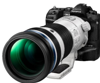
「OLYMPUS OM-D E-M1X」に 「M.ZUIKO DIGITAL ED 150-400mm F4.5 TC1.25x IS PRO」を装着

2019年1月に開発発表を行いました1.25倍テレコンバーター内蔵の高解像、超望遠ズームレンズ「M.ZUIKO DIGITAL ED 150-400mm F4.5 TC1.25x IS PRO」は、今冬の開発を目指し、現在鋭意開発を進めています。また、新たに製品の最終外観を公開いたします。