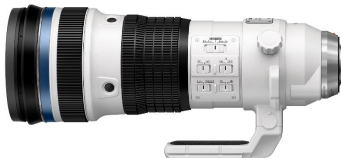
「M.ZUIKO DIGITAL ED 150-400mm F4.5 TC1.25x IS PRO」最終外観