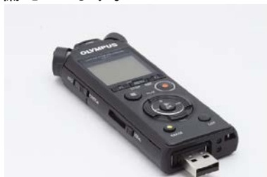
「PC ダイレクト接続」を可能にする USB 端子使用イメージ