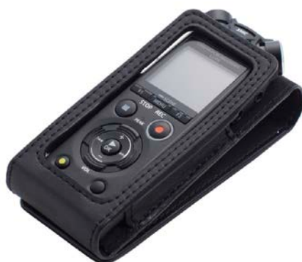
キャリングケース「CS150」使用イメージ