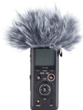
ウインドシールド「WJ2」装着イメージ

「LS-P4」に装着すると風切り音を少なくし、屋外での使用時でもクリアな録音が行えます。