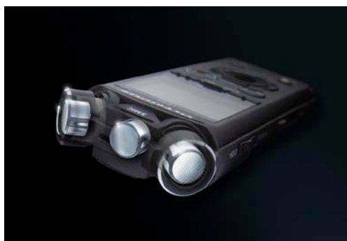
3マイクシステム「TRESMIC」透視イメージ

ステレオ感を際立たせる90度に配された2つの高性能指向性マイクに、低音域を効果的に捉える無指向性のセンターマイクを加えた3マイクシステム「TRESMIC」（トレスミック）を搭載しています。センターマイクをオンにした場合は、20Hz から80Hz の領域に多く含まれるバスドラム、ベースギターなどの低音域も録音でき、ハイレゾ対応機ならではの原音に忠実な広帯域のハイクオリティーサウンドを楽しめます。