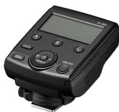
ワイヤレスコマンダー 「FC-WR」