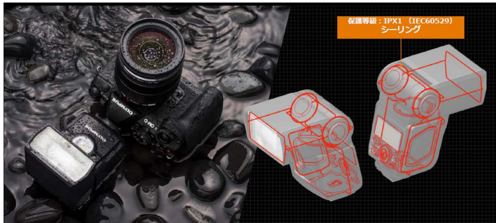
システムとしての防塵・防滴設計

最大ガイドナンバー42※2(ISO100・m)を備えたフラッシュです。大光量ながらも持ち運びしやすい小型軽量デザインを実現しています。また防塵・防滴・-10℃耐低温※1 設計の採用により、同時発表のOLYMPUS OM-D E-M1Xをはじめ、防塵・防滴設計のボディー・レンズの組み合わせで、雨の中などのさまざまな環境下においても安心して撮影できます。