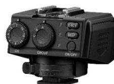
ワイヤレスレシーバー 「FR-WR」