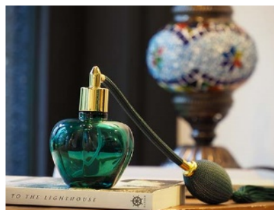
背景を大きくぼかした表現