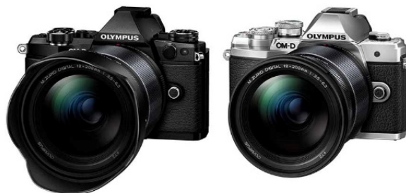
装着イメージ 左:「OM-D E-M5 Mark II」 右:「OM-D E-M10 Mark III」(シルバー)