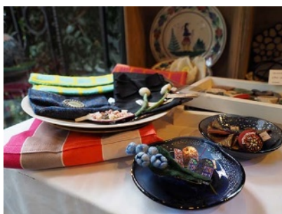
主要被写体に寄りながら、背景も写しこむ表現

広角撮影時は、最短撮影距離 約 22cm(レンズ先端から約 10cm)まで主要被写体に近寄って撮影が可能であり、背景と一緒に被写体を写しこむ表現ができます。望遠撮影時は、最大撮影倍率 0.46 倍(35mm 判換算)のクローズアップ撮影や、背景を大きくぼかした表現に適しています。子どもの表情のクローズアップをはじめ、屋内からアウトドアシーンまで、様々な被写体に 1 本で対応できる万能レンズです。