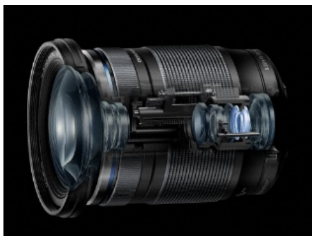
接合レンズ 1 枚からなる軽量レンズ

接合レンズ 1 枚からなる軽量レンズを移動させてピント合わせを行うインナーフォーカスを採用した MSC (Movie and Still Compatible) 機構を搭載。撮影タイムラグが短く、一瞬の撮影機会を逃しません。高倍率ズームレンズながら圧倒的な高速・高精度の AF レンズ駆動で快適な撮影を楽しめます。