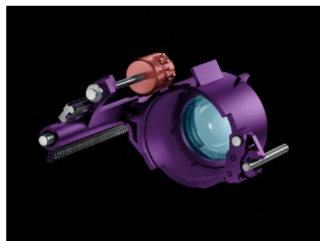
MSC (Movie and Still Compatible) 機構