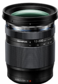
「M.ZUIKO DIGITAL ED 12-200mm F3.5-6.3」