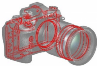
「M.ZUIKO PRO」シリーズと同等の防塵・防滴性能