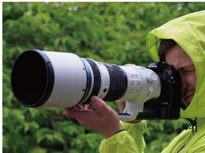
過酷な撮影条件でも安心の防塵・防滴・耐低温性を実現

鏡筒の素材にはマグネシウム合金や炭素繊維強化プラスチック(CFRP)を用い、さらにレンズフードには装着時に重心がレンズ先端に寄らないよう軽量のカーボンファイバーを採用しました。このように各所に最適な素材を使用することで、強度と精度を確保しながらも長さ 314.3mm、重さ 1875g ※5 の小型軽量化を実現しています。優れた防塵・防滴・耐低温性能も備えており、「OLYMPUS OM-D E-M1X」などと組み合わせ、雨や雪の中など過酷なフィールドであっても安心して撮影を続けられます。本レンズに施された遮熱塗装は従来の黒塗装に比べ、太陽光の赤外線を高効率に反射し、炎天下の使用でもレンズ内の温度上昇を抑えることで、安定した光学性能を発揮します。さらに最前面のレンズには滑らかなため傷がつきにくいフッ素コーティングを施し、メンテナンス性にも優れています。