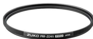
「ZUIKO PRF-ZD95 PRO」

希望小売価格 37,500 円 (税込み 41,250 円) 発売予定日 2021 年 1 月 22 日