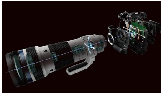
5 軸シンクロ手ぶれ補正イメージ図

「5 軸シンクロ手ぶれ補正」に対応し、300mm 相当 ※1 で世界最強 8 段 ※2 、内蔵テレコンバーター使用時の 1000mm 相当 ※1 においても 6 段 ※6 もの手ぶれ補正性能を実現しています。別売のテレコンバーター「MC-20」と組み合わせた最大 2000mm 相当 ※1 の超望遠域であっても、強力な手ぶれ補正は有効。高画質な手持ち撮影が行えるため、モータースポーツやネイチャーなどの分野で威力を発揮します。また、オリンパス独自の高精度薄肉レンズ加工技術によって、フォーカスレンズの軽量化を図っており、ズーム全域で高速かつ高精度なフォーカシングが可能です。