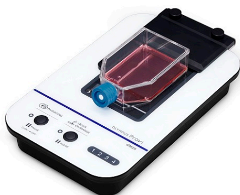
OLYMPUS Provi CM20

※1 2020 年 1 月より日本および米国で販売。（ https://www.olympus.co.jp/news/2020/nr01501.html ）