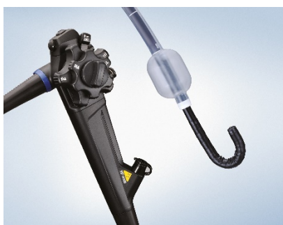
EVIS EXERA III 小腸ビデオスコープ OLYMPUS SIF-H190