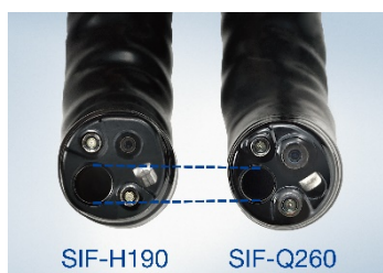
鉗子チャンネル比較 SIF-H190（左）従来製品（右）

本製品は、従来製品の外径を維持したまま、鉗子チャンネルを 2.8mm から 3.2mm に拡大しました。これにより、処置具の可動域が増えることで操作性向上に寄与します。