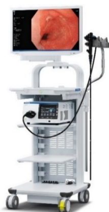
内視鏡システム「EVIS X1」 (システムセット例)

「EVIS X1」は、オリンパス独自の技術の搭載に加え、従来機である「EVIS LUCERA ELITE」と「EVIS EXERA III」の、それぞれ異なるスコープラインアップとの互換性も確保しています。これにより幅広いラインアップのスコープをお使いいただけ、内視鏡による診断・治療の可能性拡大に貢献します。