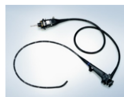
(右上) 上部消化管汎用ビデオスコープ OLYMPUS GIF-EZ1500