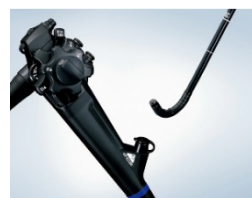
(左下) 上部消化管汎用ビデオスコープ OLYMPUS GIF-XZ1200