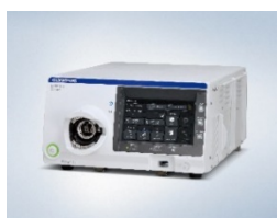
(左上) EVIS X1 ビデオシステムセンター OLYMPUS CV-1500