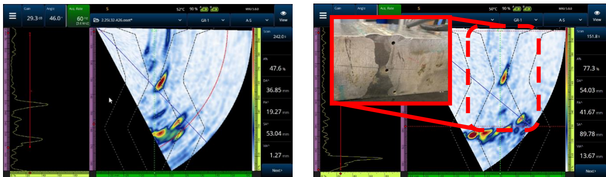
検査データの取得イメージ比較（左：OmniScanX3、右：OmniScanX3 64）

ミドルレンジモデルの「OmniScanX3」では同時制御可能な超音波素子が 32 個であったのに対し、本製品では 64 個の超音波チャンネルを搭載しています。本製品は 64 個の超音波チャンネルを同時に制御することで、より強い超音波の入射と、よりフォーカスの合った画像化を実現します。これにより、例えば発電所や化学プラントの圧力容器の溶接部のような厚みがあって、超音波が伝導しにくい素材でできた検査対象物であっても、微細な傷を高精度に検出することが可能です。また、これらの機能向上を実現しながらも、前機種と同じ 5.7kg の小型軽量の筐体と同じバッテリー駆動時間を維持し、ユーザーの携帯性を担保しています。IP65 にも準拠しており、屋外の過酷な検査環境でも安心して使用できます。さらに内部ストレージも最大 1TB の検査データを保存することができるので、長時間にわたる検査も 1 度に行うことができます。