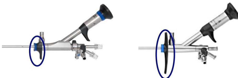
左：従来機種、右：OES ELITE ウレテロレノスコープ ハンドルを握る際に指をかける部分を長くしたことで、より握りやすい形状としている。

人間工学に基づいたハンドル操作部のデザインにより、安定したスコープ操作をサポートし、医師の負担低減に寄与します。