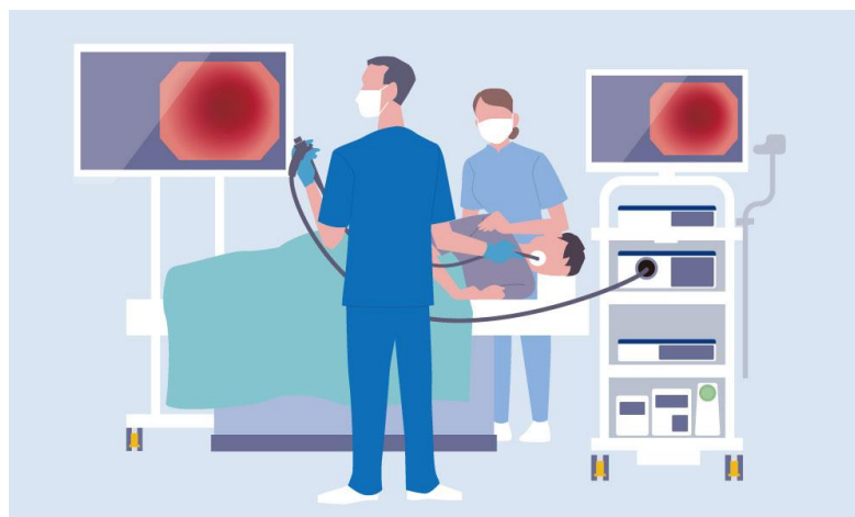
【図 1 内視鏡とは】